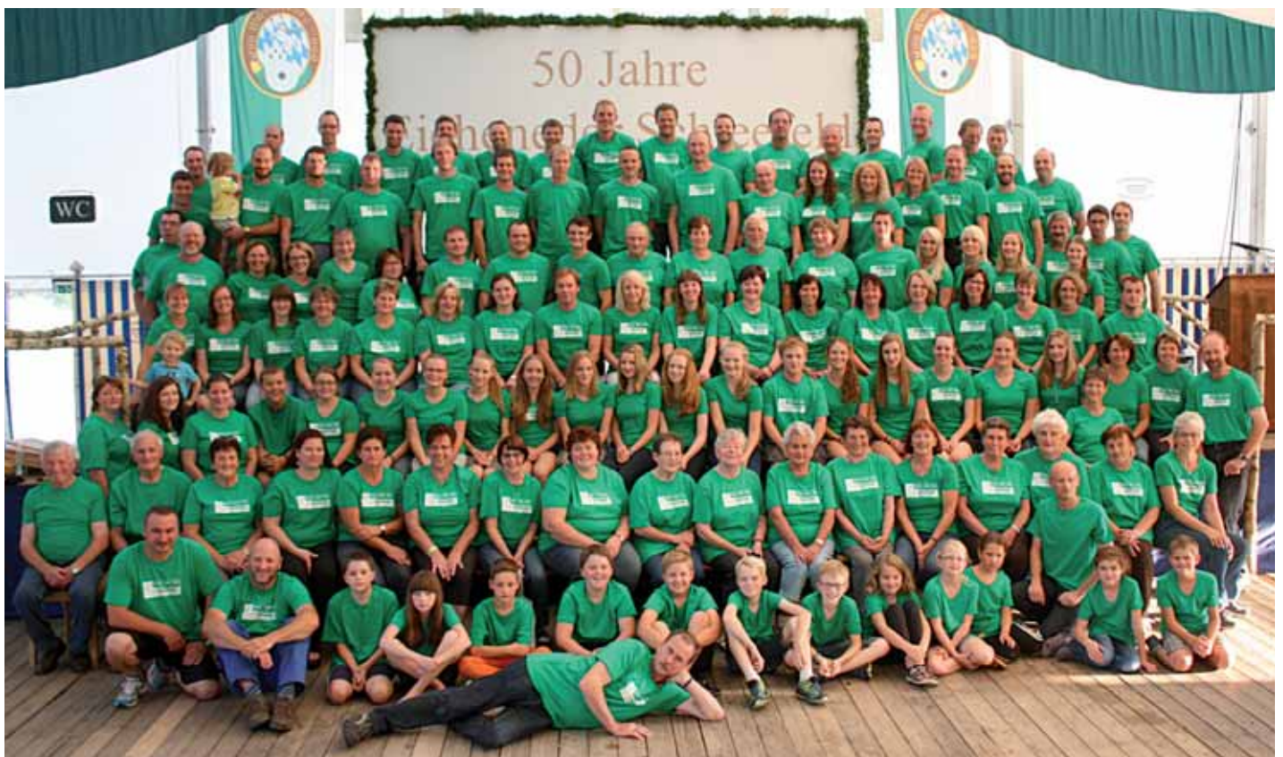
Die über 120 Helfer mit den von der Firma Sebastian Grandl aus Hinterschleefeld gespendeten Arbeits-T-Shirts.

durchaus abwechslungsreichen teilnehmende Verein sein Erinnerungstrachten zu bewundern. Nach dem Mittagessen erhielt jeder