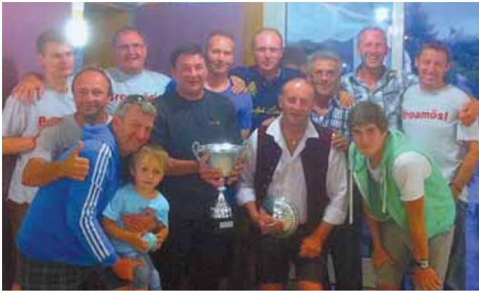
Viele glückliche Gesichter gab es bei der Siegerehrung des Maitenbether Dorfvierkampfs.