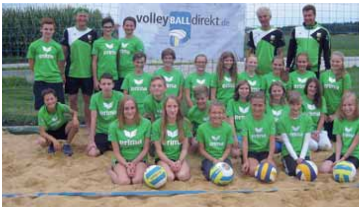
Die Jugendlichen mit Betreuer auf dem Beachvolleyballplatz.