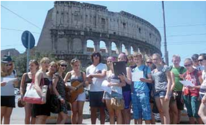
Gemeinsames Singen vor dem Colosseum: Die Albachinger Ministranten in Rom.