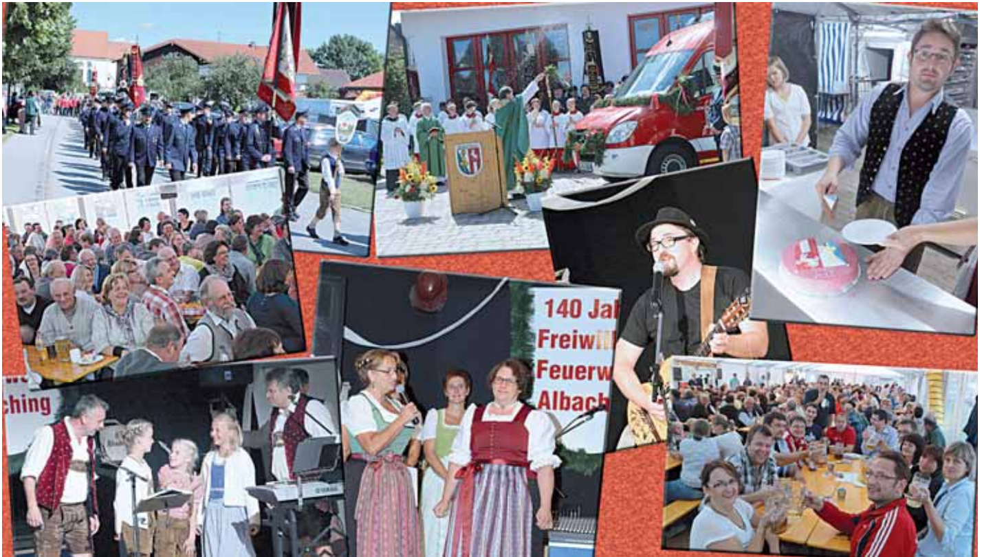
Impressionen von den tollen Festtagen der Feuerwehr Albaching.