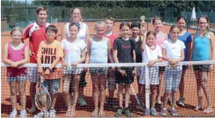
Diese gemischte Jugendmannschaft der Steinhöringer Tennisler gewann im Freundschaftsspiel gegen den SVA mit 7:2.