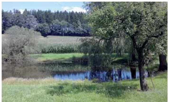
Schauplatz der Wagner-Festspiele am 31. September: Der idyllische Weiher bei Koblöd.

Vielleicht auch aus diesem Anlass, sicherlich aber vor allem wegen der hervorragenden, naturbelassenen Open-Air-Location am Koblöder Weiher, haben sich die Verantwortlichen vom sogenannten „grünen Hügel“ der Bayreuther Festspiele entschlossen, eine einmalige Aufführung der kompletten vier Teile von Wagners Oper „Der Ring der Nibelungen“ an den östlich des Anwesens von Richard Wagner und seiner Familie in Koblöd bei Forsting gelegenen Weiher zu verlegen. Für alle Besucher steht somit ein Operngenuß der Superlative