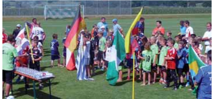
Die Kinder wurden den Ländern zugelost.

Insgesamt waren es 31 Kinder im Alter von 6 bis 13 Jahren. Jetzt kann die neue Saison endlich beginnen und hoffentlich das Erlernete auch richtig umgesetzt werden.