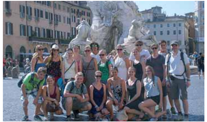
Gruppenbild am Piazza Navona: Die jungen Albachinger Wallfahrer kamen dem Hl. Vater Papst Franziskus ganz Nahe.