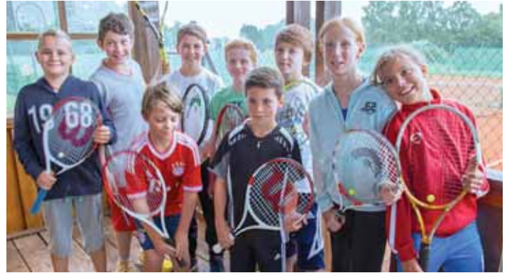
Der Tennismannschaft aus Albaching und Pfaffing holte den Meistertitel in der Kreisklasse.