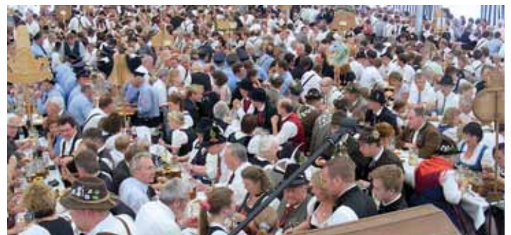
Ein Blick ins volle Bierzelt am Festsonntag.

durchaus abwechslungsreichen teilnehmende Verein sein Erinnerungstrachten zu bewundern. Nach dem Mittagessen erhielt jeder