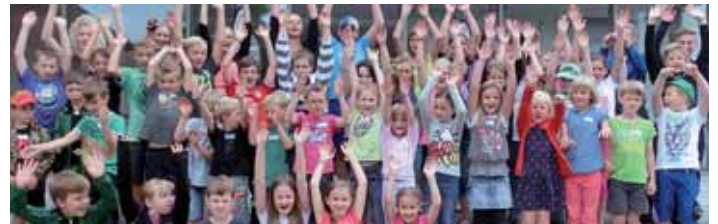
Diese fröhliche Schar war beim „Tag der offenen Tresortür“ dabei.

Die Jugendberaterinnen der Raiffeisenbank RSA freuten sich dieses Jahr wieder ganz besonders auf die Übergabe der Kindergarten-Diplome an die zukünftigen Schulanfänger. Die angehenden Schüler erhielten das Kindergarten-Diplom der RSA-Bank sowie viel Nützliches für den Schulunterricht überreicht. Zum Beispiel einen Malkasten, ein Hausaufgabenheft und ein Stundenplan. Aber auch der Spaßfaktor kam bei den Geschenken nicht zu kurz, so wird es in den Sommerferien mit Seifenblasen, einem Wissensquartett und vielen Kleinigkeiten