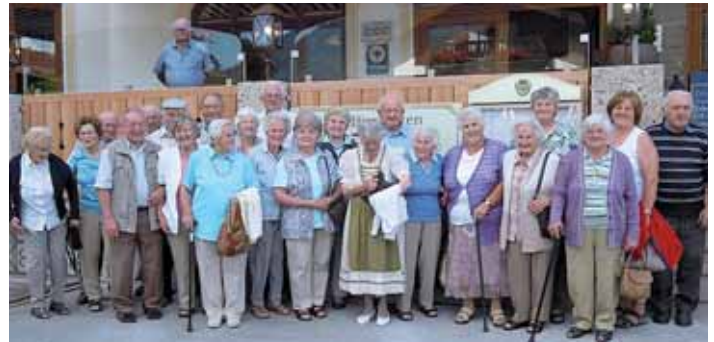
Immer fröhlich und gut gelaunt unterwegs: Der Seniorenkreis Albaching „auf Tour“.