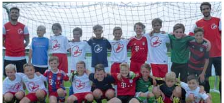
Einige Teilnehmer des Trainingscamps.