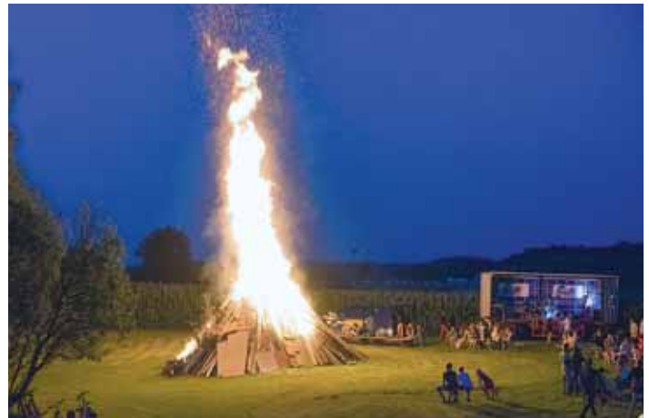
Grandiose Stimmung herrschte beim Petersfeuer mit Liveband und zahlreichen Besuchern.

Die Liveband wurde von FM Djs abgelöst (Felix Maier und Michael