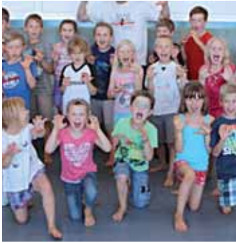
Zahlreiche Kinder nahmen am Kurs teil.